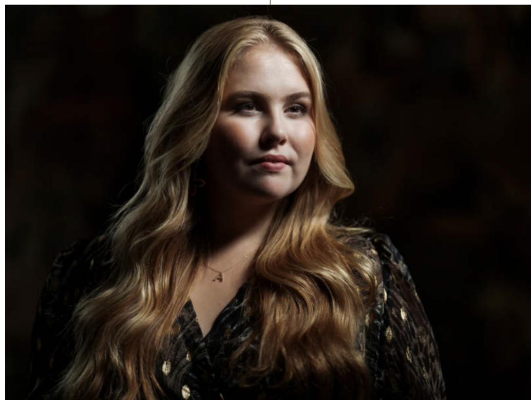
Prinses Amalia, 18 jaar